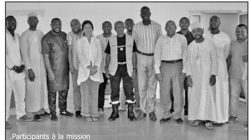
Participants à la mission

Les Comores sont très vulnérables aux catastrophes climatiques et autres catastrophes naturelles (inondations, cyclones, éruptions volcaniques, tremblements de terre et tsu-