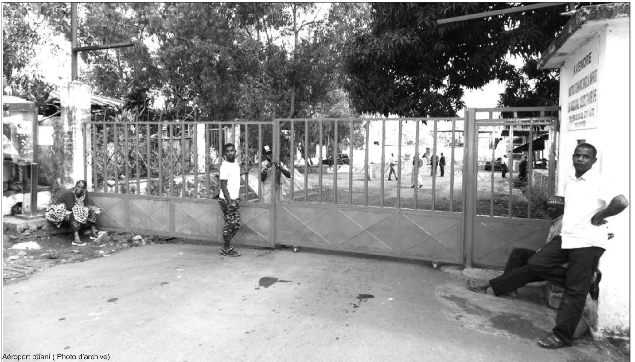
Aéroport ouani ( Photo d'archive)