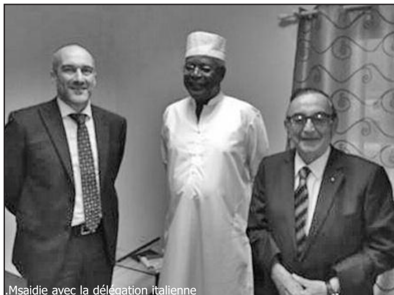
Msaidie avec la délégation italienne